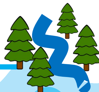
Rejet dans la nature